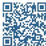
Aplikace pro IOS