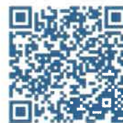
Aplikace pro Android

V přechodném období očekáváme na pobočkách fronty a přetížené telefonní linky. Pokud nebudete mít možnost nebo z nějakého důvodu nebudete chtít využít online podání žádosti o superdávku, můžete případně využít tzv. asistované podání na našich pobočkách.